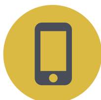
Teléfono Móvil Smartphone